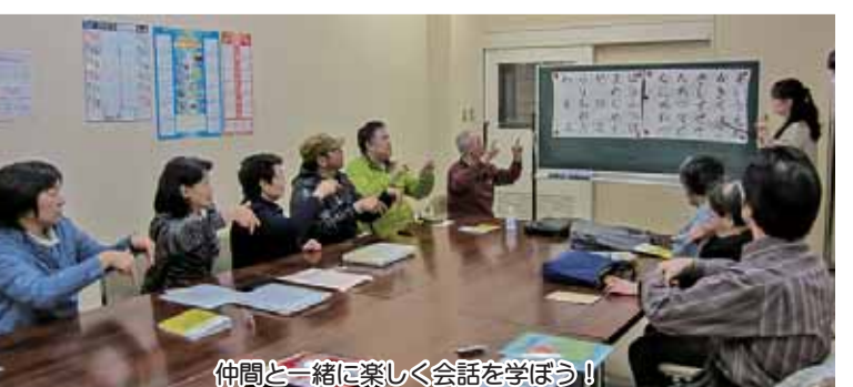
仲間と一緒に楽しく会話を学ぼう!