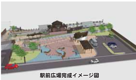
駅前広場完成イメージ図

去る平成26年12月18日にご逝去されました稚内市名誉市民 故 井須 孝誠 氏の市葬「追悼の会」が、2月15日(日)に市内ホテルで執り行われました。追悼の会には、約800人が参列し、故 井須 孝誠 氏との別れを惜しんでいました。