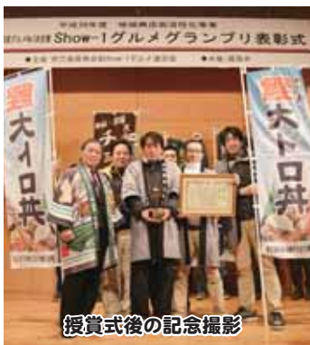
授賞式後の記念撮影

◆「枕崎大トロ丼」がShow-1グルメグランプリで優勝！ 12月号で紹介した、新たな昆鯉料理「枕崎大トロ丼」が鹿児島県商店街ナン