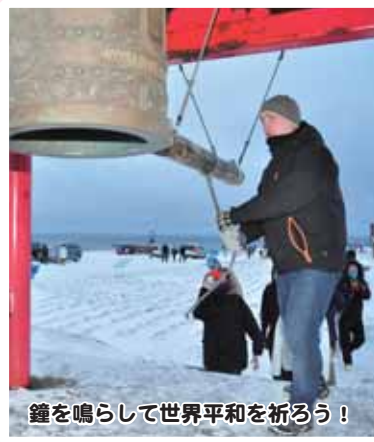
鐘を鳴らして世界平和を祈ろう!