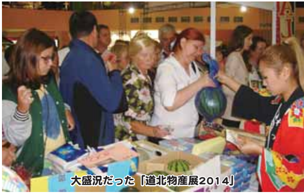
大盛況だった「道北物産展2014」

9月6日〜7日、サハリ ン州ユジノサハリンスク市 内の商業施設「シテイ モール」を会場に、「ユジノ サハリンスク道北物産展2 014」を開催しました。 この物産展は、道北地域 企業が取り扱う商品の販路 開拓と稚内・コルサコフ航 路を利用した貨物輸送の増 加を目指して開催されまし た。