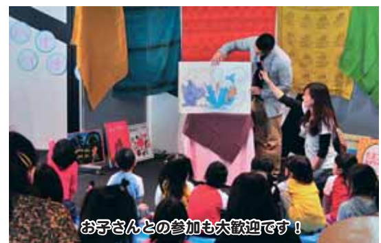
お子さんとの参加も大歓迎です!

なっています。どうぞ、皆さん気軽にお越しください。 活動日時 ／ 毎月第3土曜日 13時~13時30分 活動場所 ／ キタカラ2階 多世代交流ロビー (中央3丁目6番1号) ☆チームメンバー募集中!