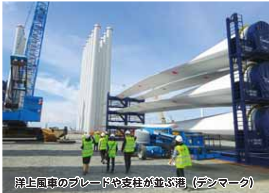
洋上風車のブレードや支柱が並ぶ港（デンマーク）

このまちの将来にとって再生可能エネルギーの推進に、今後どのように取り組んでいくかは、非常に大事なテーマの一つだと考えていましたので、絶好の機会を得たと思ひ参加させてい