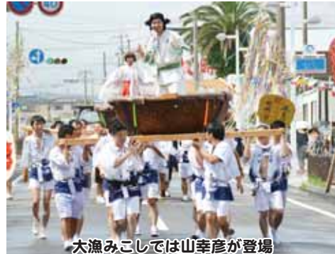
大漁みこしでは山幸彦が登場