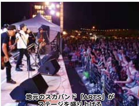
地元のスカバンド「ARTS」がステージを盛り上げる