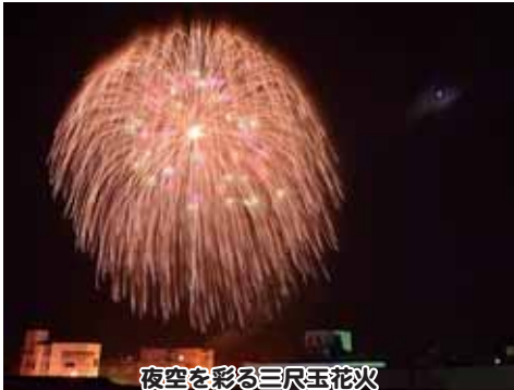
夜空を彩る三尺玉花火

ムも残念ながらありませんが、実施されたプログラムでは各会場で盛り上がりを見せていました。