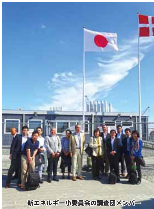
新エネルギー小委員会の調査団メンバー

小委員会は、今年度中の活動ですがそのような機会に関われたことに感謝し、今後の市政運営に役立たせたいと考えています。