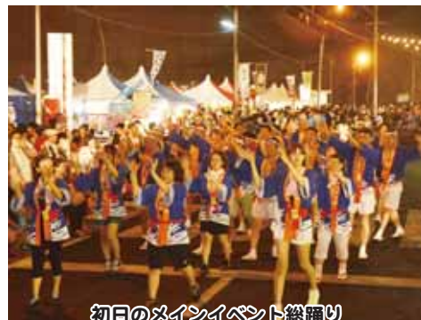
初日のメインイベント総踊り