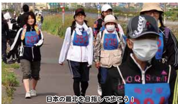
日本の最北を目指して歩こう!

〒097-8686 稚内市中央3丁目13番15号 市秘書広報課広報グループ ☎23-6387 ㊟23-3281 ✉hisuyokoho@city.wakkanai.hokkaido.jp