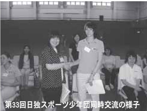
第33回日独スポーツ少年団同時交流の様子

北海道ブロックの稚内市を訪れるドイツスポーツユースの団員は、ドイツのベルリン・ブランデンブルグ州の指導者1名、団員6名の7名の交流団と通訳1名が、8月1日(金)〜6日(水)の6日間、わたり国際親善交流を深めます。