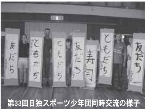
第33回日独スポーツ少年団同時交流の様子

私たちにできるフェアプレイ「スポーツでも、日常生活でも」を交流テーマに文化交流や宿泊交流などを通して、文化の違いや生活習慣の違いを感じながら両国の団員たちにとって貴重な国際交流となることを期待しています。