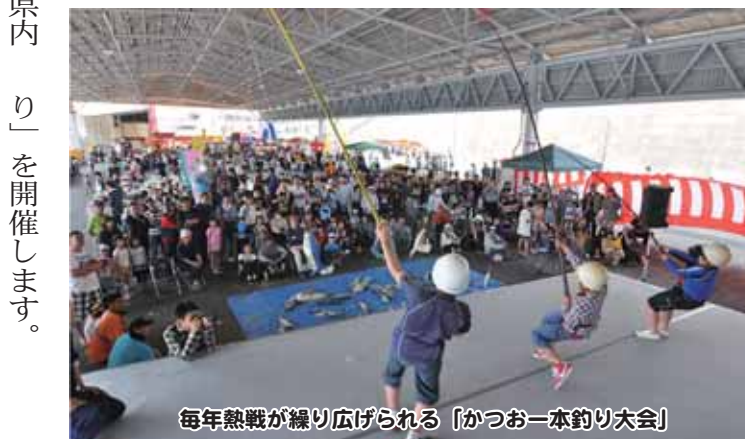
毎年熱戦が繰り広げられる「かつお一本釣り大会」

かつお一本釣り大会や鰹節削り大会など、様々な催しが行われるほか、枕崎鰹船人めしやかつおラーメンなどのご当地グルメも多数出店予定です。鰹に見立てた砂袋を釣り上げる重さと速さで競う「かつお一本釣り大会」は、毎年、幼児から大人まで多くの参加があり、熱戦が繰り広げられます。