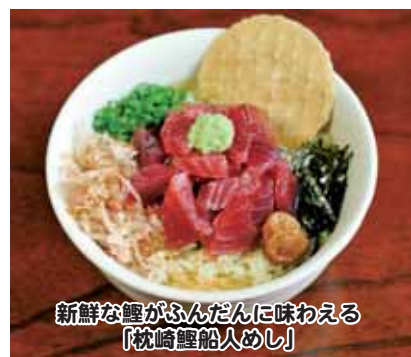
新鮮な鰹がふんだんに味わえる「枕崎鰹船人めし」

新たな名物としては、商店街活性化の起爆剤になればと開発された「枕崎鰹船人めし」が、県内商店街グルメナンバー1を決める「Show-1グランプリ」で2連覇を達成し、今年殿堂入りを果たしました。