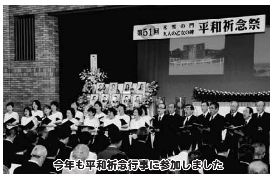
今年も平和祈念行事に参加しました