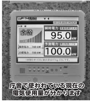
庁舎で使われている現在の電気使用量がわかります

市本庁舎及び市の各施設では、ロビー、廊下、執務室等における照明の間引き、本庁舎エレベーターの1台