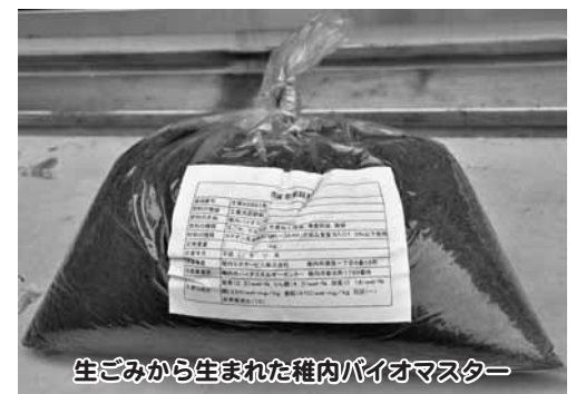
生ごみから生まれた雑内バイオマスター