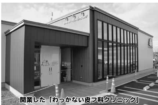
開業した「わかっかない皮フ科クリニック」

ご承知のとおり、この開業医誘致助成制度は、身近に診療を受けられる「プライマリーケア」の充実、ひいては、二次医療圏域のセンター病院である市立稚内病院を中心とした、地域医