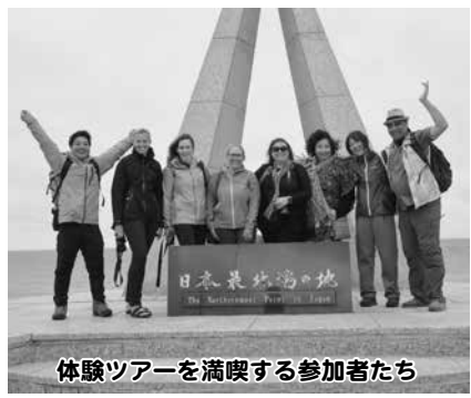
体験ツアーを満喫する参加者たち

会参加者を対象に開催される「ポスト・サミット・アドベンチャー」と呼ばれる体験ツアーの受け入れを行いました。