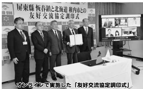
オンラインで実施した「友好交流協定調印式」