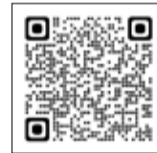
マイナポータルの二次元バーコード