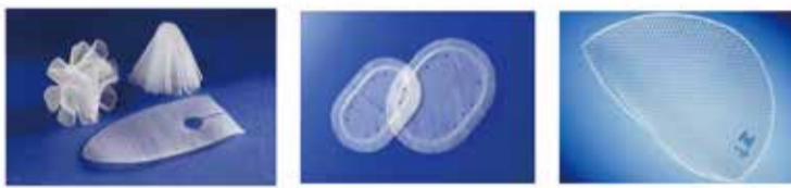
【さまざまな「メッシュ」があります】

このように、患者さんの全身状態やご希望に沿って最適な治療法を選択することができます。