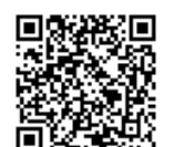
ステージ発表フォーム申込