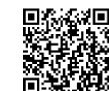
体験コーナーフォーム申込