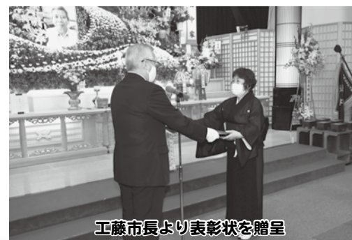
工藤市長より表彰状を贈呈

さらには、平成27年10月からは「地域医療を考える稚内市民会議」の発足に尽力されたほか、平成29年8月に発足した「医療と健康のまちづくり応援団」の中心的な役割を担って精力的に活動され、地域医療の充実に貢献した功績は多大であります。