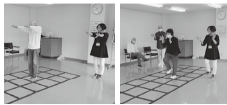
基本のステップからの

ここで 驚き!! 感動!! なんと参加したみなさんがステップに成功!! さすが8年間の継続……。毎回みんなで大きな声で笑ひ、歌ひ、愉快的な気持ちで終わるとのことでした。