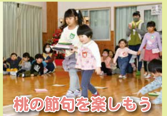
桃の節句を楽しもう