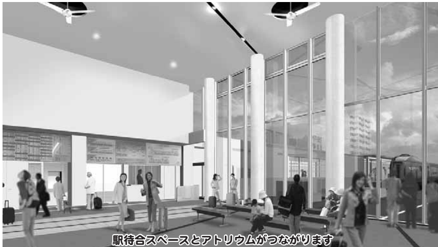
駅待合スペースとアトリウムにつながります

再開発ビル第1期工事は、旧駅舎の解体工事終了後の7月から住宅棟と地域交流センター部分の建設や、新駅舎と再開発ビルの接続を行う工事がスタートしています。◆建物がつながり、駅待合スペースが広くなります