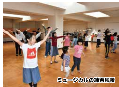
ミュージカルの練習風景