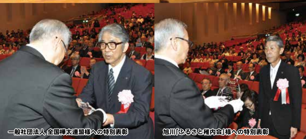
一般社団法人 全国樺太連盟様への特別表彰