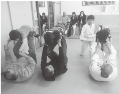
南部柔道少年団の幼児の活動の様子

● アクティブ・チャイルド・プログラム普及講習会 趣旨：幼児期のスポーツ活動 期日：平成30年7月8日(日) 会場：総合勤労者会館・体育センター 参加：(1)スポーツ少年団関係者(指導者、保護者他) (2)日本スポーツ協会公認スポーツ指導者 (3)幼稚園、保育所等関係者 (4)その他 内容：講義、実技