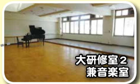
大研修室2 兼音楽室

グランドピアノを設置しています。 会議室としても音楽ホールとしても 利用いただけます。