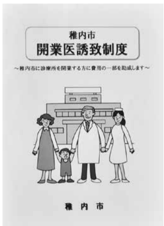
～誘致制度の パンフレット～

ないでしょうか？ なお、当課までご連絡を いただければパンフレット の送付など早速対応させて いただきます。医師確保に 向けて、市民の皆様のご協