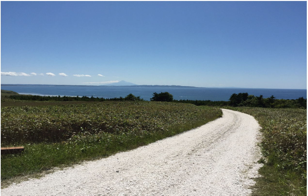
宗谷丘陵の白い道