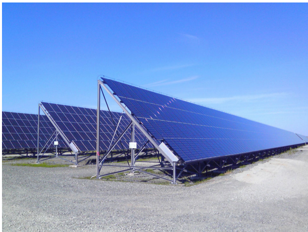
稚内メガソーラー発電所