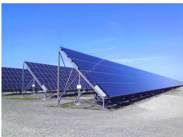
稚内メガソーラー発電所