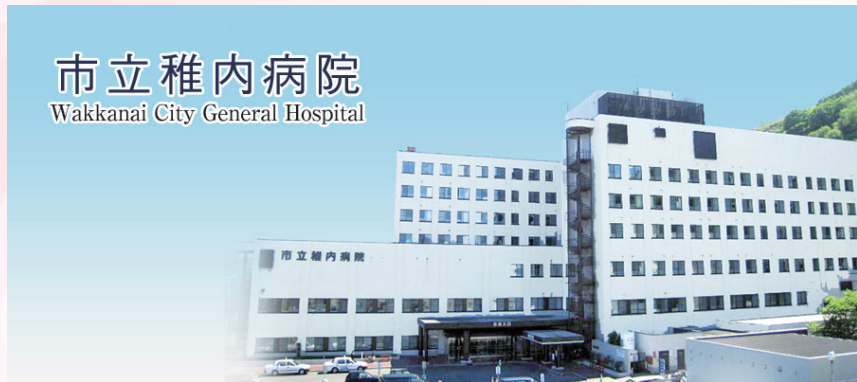
市立稚内病院 Wakkanai City General Hospital