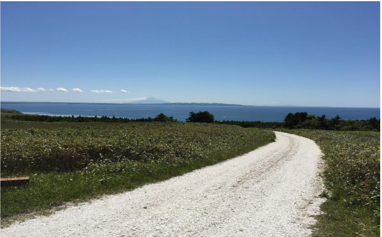
宗谷丘陵の白い道