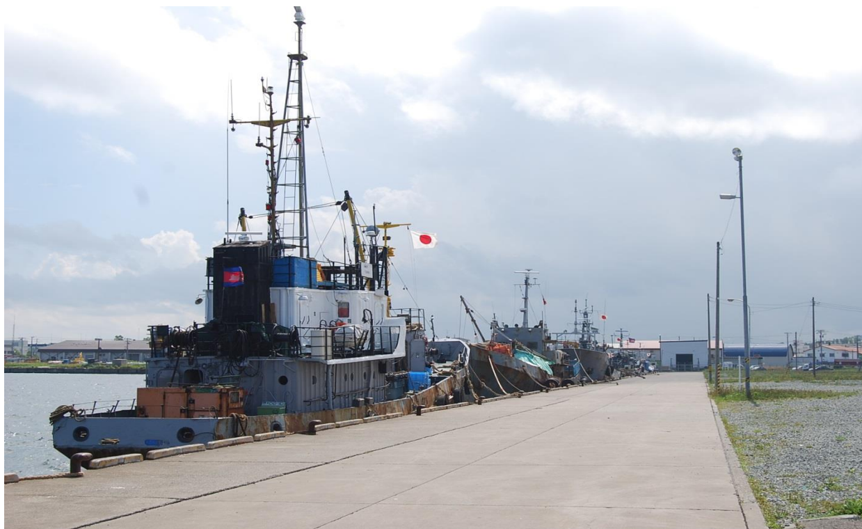
末広埠頭に接岸中の外国船