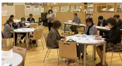
東地区学校運営協議会