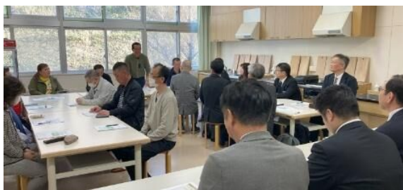
宗谷地区学校運営協議会