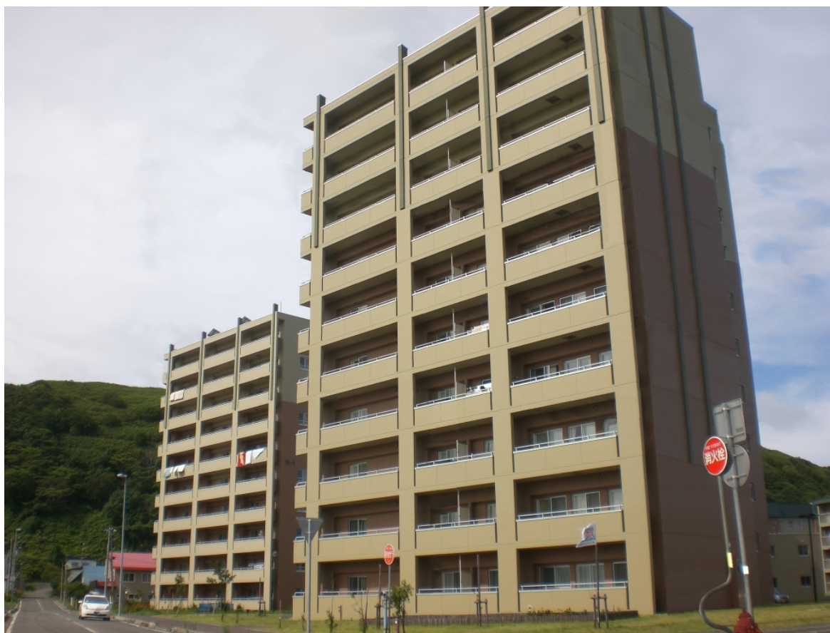
宝来地区市営住宅