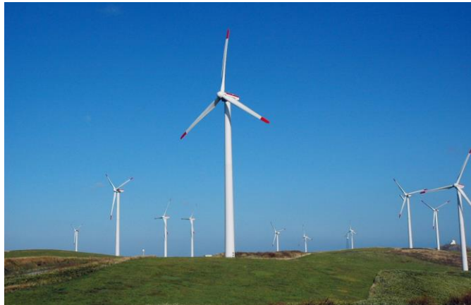
宗谷岬ウインドファームの風車群