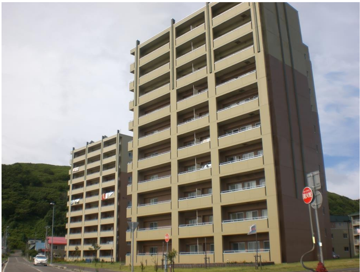
宝来地区市営住宅