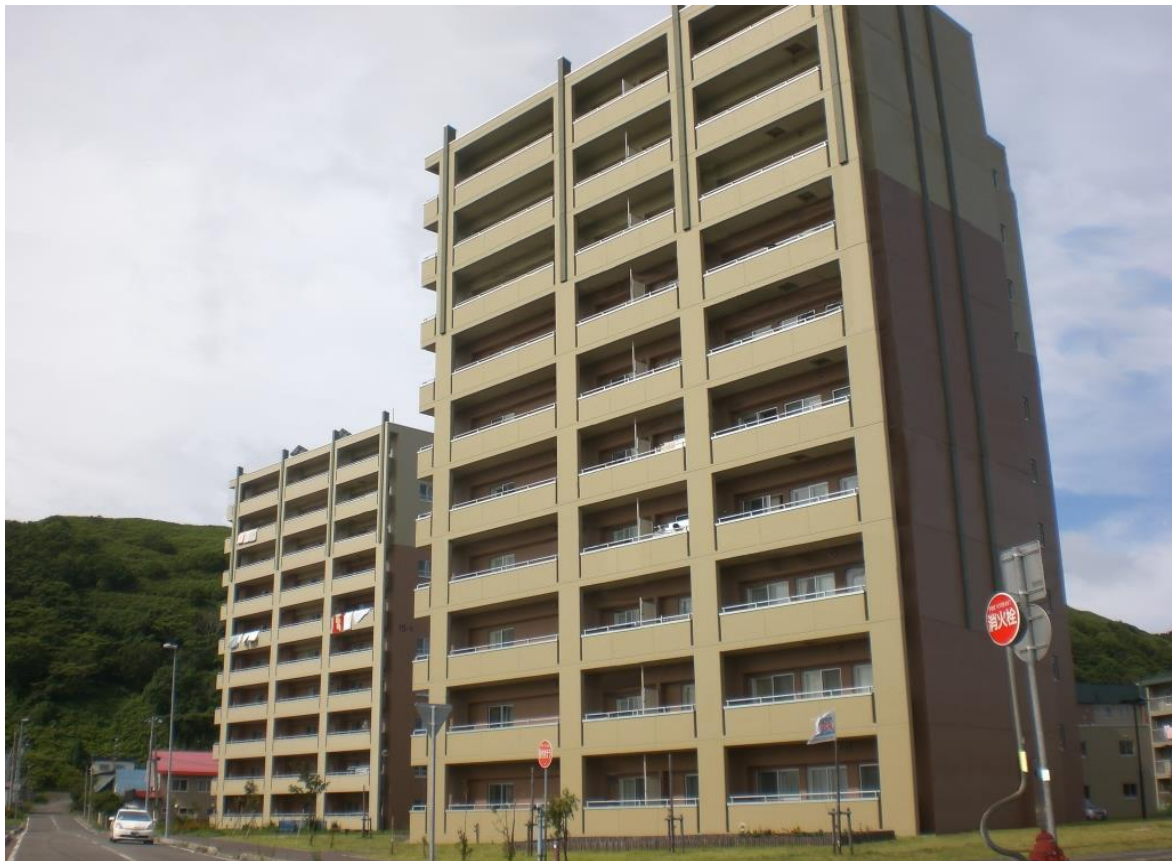
宝来地区市営住宅