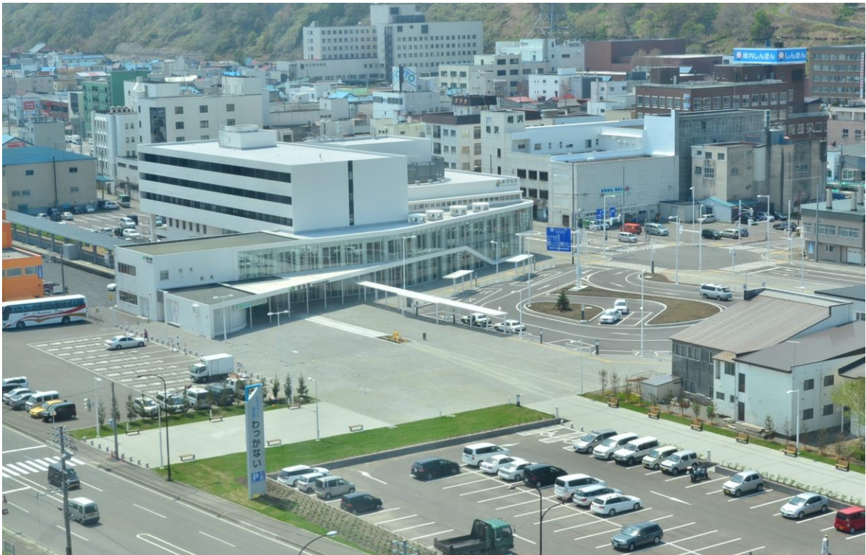
稚内駅前周辺 複合施設KITAcolor(キタカラ)・JR稚内駅・道の駅わっかない