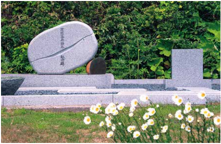
쓰가루번 무사 종합 기념비