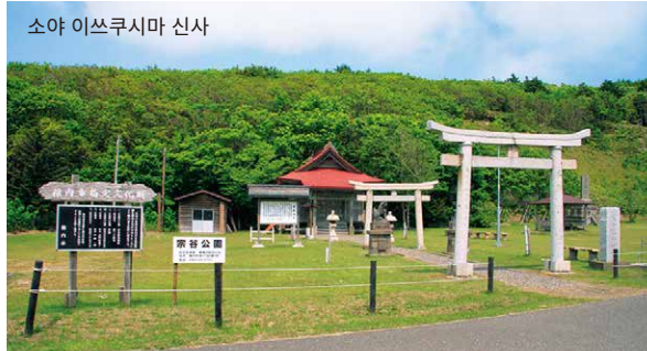
소야 이쓰쿠시마 신사

왓카나이 발상지· 구 소야무라에 있으며 많은 사적과 문화재가 남은 공원은 역사를 좋아한다면 필견. 왓카나이(소야)는 일본에서 처음으로 무사 계급이 커피를 마신 지역이라 전해지며 독특한 원두커피형 기념비도 있습니다.