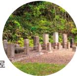
구 번청 무사의 묘

왓카나이 발상지· 구 소야무라에 있으며 많은 사적과 문화재가 남은 공원은 역사를 좋아한다면 필견. 왓카나이(소야)는 일본에서 처음으로 무사 계급이 커피를 마신 지역이라 전해지며 독특한 원두커피형 기념비도 있습니다.