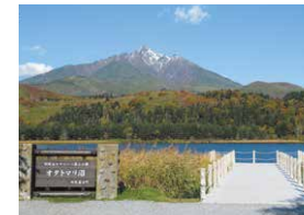
О-в Рисири: оз. Отатомари