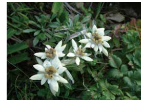
Пос. Рэбун: Эдельвейс японский

Находящийся на территории одного города и 5 поселков (г. Вакканай, пос. Рисири, пос. Ризири Фудзи, пос. Рэбун, пос. Тоётоми и пос. Хоронобэ) самый северный в Японии национальный парк был создан в 1974 г. Отправимся в путь по территории парка, наслаждаясь видами, пробуя местную еду, ощущая природу всеми пятью чувствами!