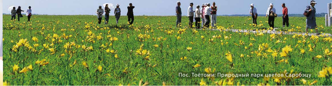
Пос. Тоётоми: Природный парк цветов Саробэцу

Находящийся на территории одного города и 5 поселков (г. Вакканай, пос. Рисири, пос. Ризири Фудзи, пос. Рэбун, пос. Тоётоми и пос. Хоронобэ) самый северный в Японии национальный парк был создан в 1974 г. Отправимся в путь по территории парка, наслаждаясь видами, пробуя местную еду, ощущая природу всеми пятью чувствами!