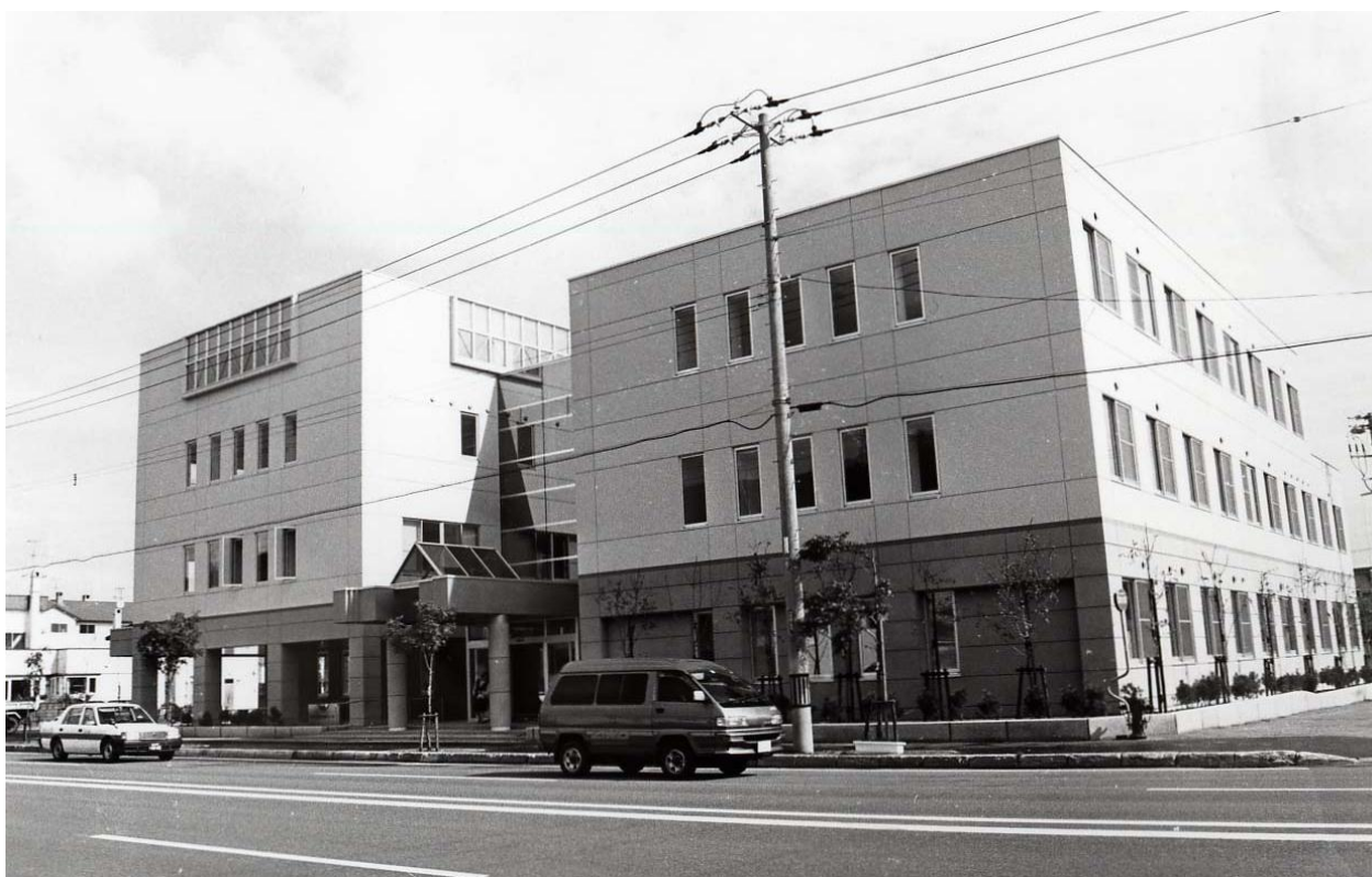
稚内市保健福祉センター