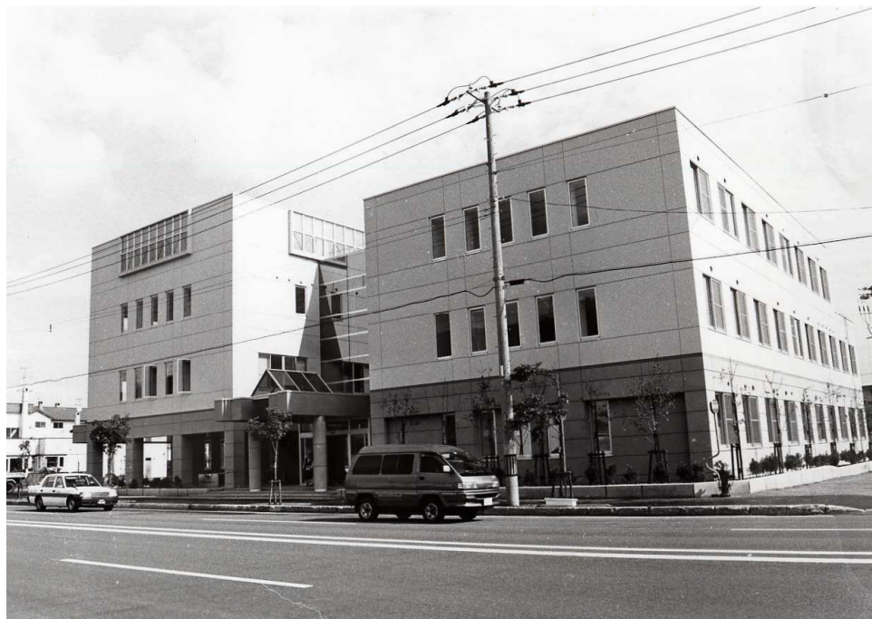
稚内市保健福祉センター