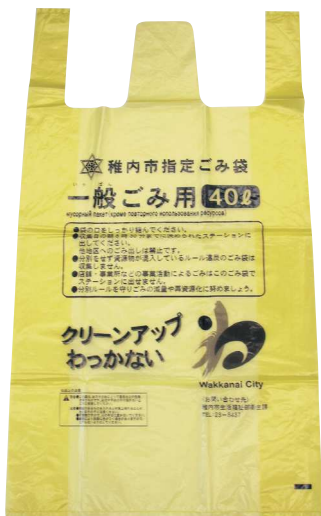
有料指定ごみ袋 (一般ごみ用)