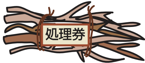
伐採した木や枝など