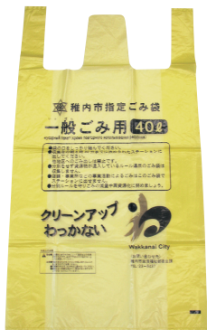
有料指定ごみ袋 (一般ごみ用)