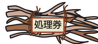
伐採した木や枝など