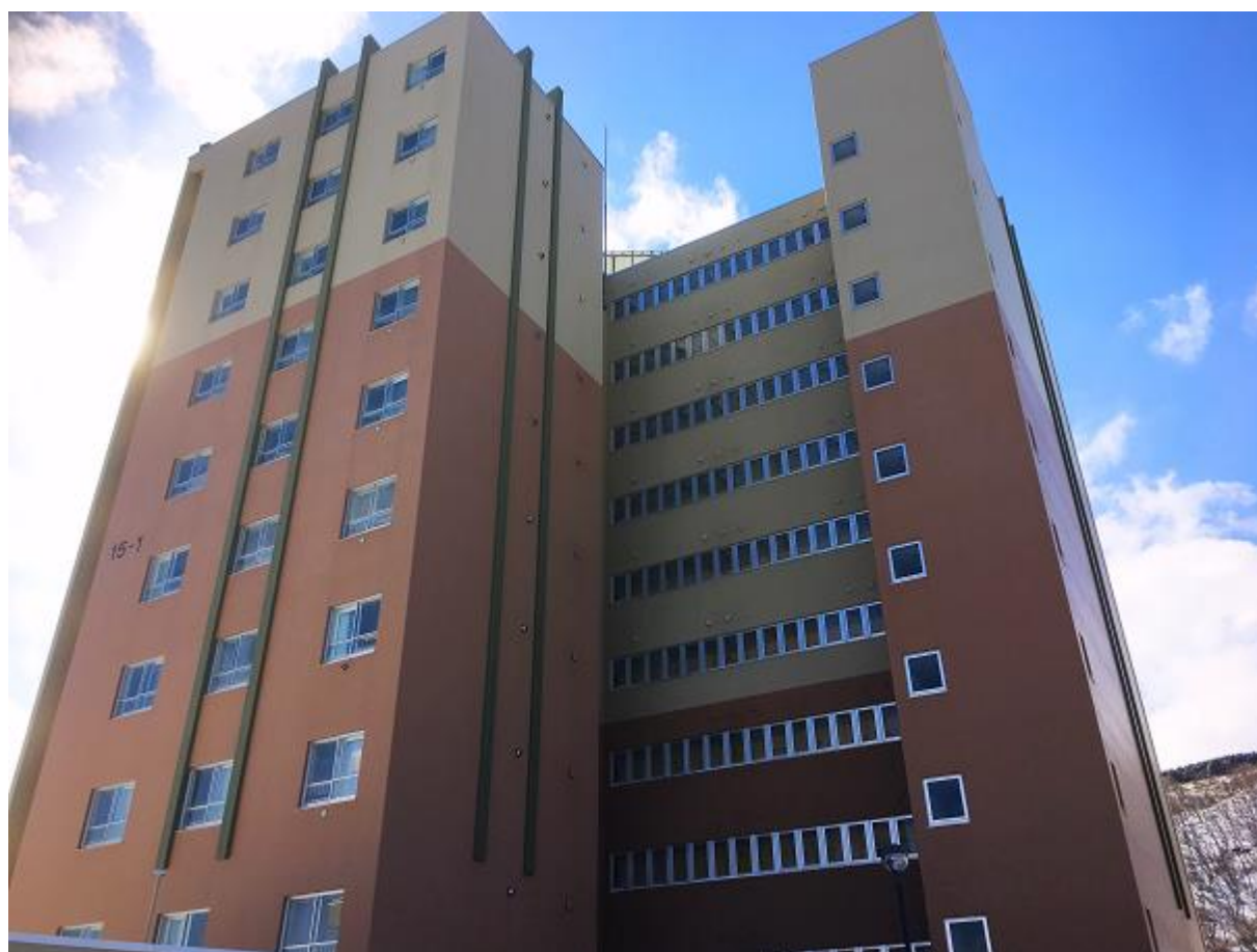
市営宝来団地 15-1 棟外観