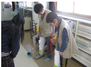
高齢者疑似体験と 車いす操作の学習