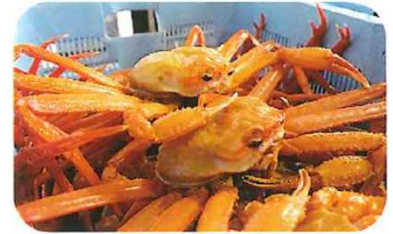
稚内産紅ズワイガニ