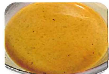
ズワイガニ殻の出汁