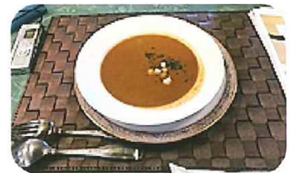
わっかないビスク