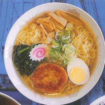
ラーメンとすり身 異色のコラボ 「ネオすり身ラーメン」(北の香り)