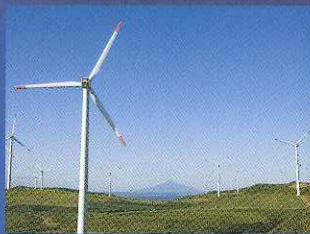
▲北海道遺産「宗谷丘陵(周水河地形)」から見る風車

日本の最北端に位置し、宗谷岬からわずか43kmキ口先には「サハリン(旧樺太)」の島影を望む国境の街。周辺には最北の国立公園「利尻礼文サロベツ国立公園」を中心とした観光地も多くみられる。また、日本海とオホーツク海に囲まれた稚内は海産物の宝庫でもあり、カニやウニ、ホタテなどの新鮮な魚介類が水揚げされるほか、「たこしゃぶ」などの名物料理も多数。風力発電や太陽光発電などエコを目指す街でもある。