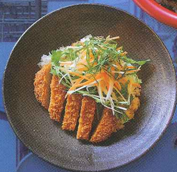
シャッキリ野菜とカツが絶妙 「香味野菜のしょうゆあん」(寄処「旬」)