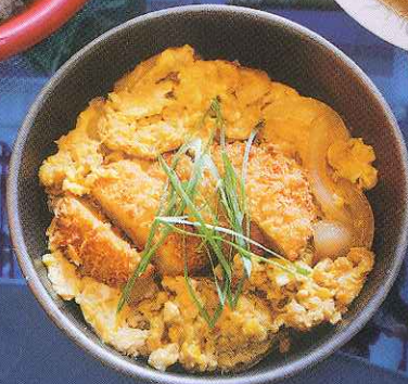
すり身のカツで「玉子とじカツ」 (稚内副港市場 底曳船)