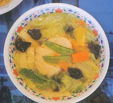
あーさり塩味で野菜もたっぷり「ネオすり身ラーメン」 (稚内温泉童夢「レストランク風」)