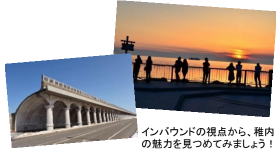
インバウンドの視点から、稚内の魅力を見つめてみましょう！

今回のセミナーでは具体的な取り組み事例を有するスピーカーをお迎えし、今注目される欧米豪市場からのインバウンド旅行者がもたらす地域への効果を、様々な観点から解き明かしていきます。